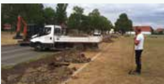
Die Fa. Kopka beim Ziehen der Gräben für die Beregnungsanlage

Nach der Saison ist vor der Saison, so heißt es nicht nur bei den Fußball spielenden Proficlubs Land auf Land ab, nein auch in Stotternheim wurde einiges getan, damit die hier spielenden Kicker beste Bedingungen vorfinden und ihrem Hobby voller Zufriedenheit nachgehen können. Hierzu hat der Erfurter Sportbetrieb (ESB) auf dem Hauptplatz eine automatische Beregnungsanlage mit 13 einzeln ansteuerbaren Beregnungspunkten installiert, die eine Beregnung des gesamten Platzes in kürzester Zeit ermöglicht. Die Gräben gezogen und Rohre verlegt hat die Garten- & Landschaftsbau-Firma Kopka aus Gierstädt. Mitarbeiter des ESB haben dann die 13 Regner angeschlossen und die Steuerung programmiert. Später sollen auch noch am Nebenplatz zwei Entnahmestellen (Hydranten) angeschlossen werden, die eine Beregnung dieses Platzes um ein Wesentliches