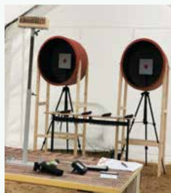
▲ Neuerung beim Seefest – eine elektronische Schiessanlage

Manche erscheinen sogar hernach zu einem ›Schnupper- Training‹, wie am darauffol- genden Donnerstag bereits ge- sehen. Die jeweiligen Sieger