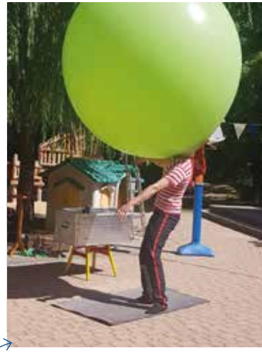
Sehr spannend war als der Clown in einen riesengroßen Luftballon gestiegen ist. Zuerst sah man nur noch die Arme, dann nur noch den Kopf und dann war er auf einmal ganz im Luftballon verschwunden.