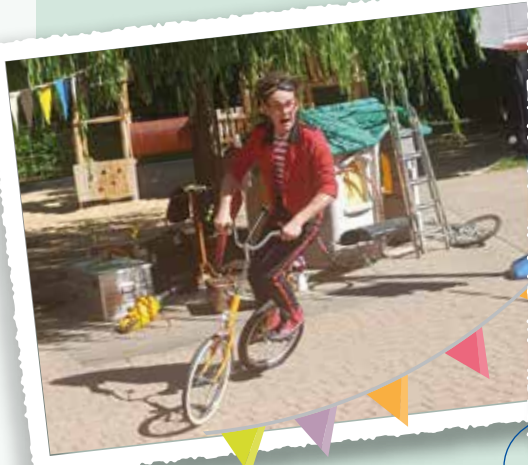
Der Kaosclown kam zu uns und brachte alle Kinder und Erzieher zum Staunen, Lachen und zum Mitmachen.